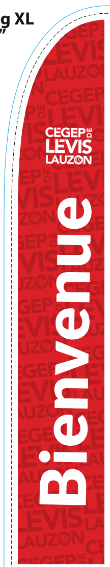
Beach Flag XL 33" x 177"

Voici quelques utilisations possibles du logo sur certains objets :